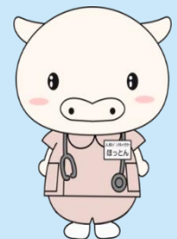
人材バンクキャラクター ほっとん

〒211-0053 川崎市中原区上小田中6-22-5 川崎市総合福祉センター(エPOCHなかはら)5階 【TEL】 044-739-8726 / 【FAX】 044-739-8740 【HP】 https://kawasaki-jinzaibank.jp 【MAIL】 jinzai@csw-kawasaki.or.jp