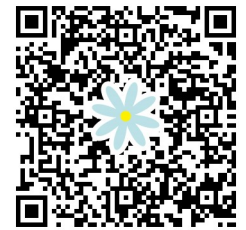
申込み用二次元コード

右記の二次元コードよりお申込みください。 申込時に、受付完了のメールが届いているか必ず確認してください。 ※メールが届かない場合、受付ができていない可能性がありますので、ご注意ください。