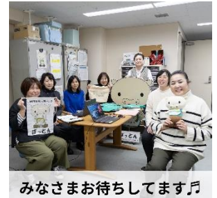
みなさまお待ちしております♪

川崎市内の福祉人材確保を図るため、福祉分野(主に介護)に関心のあるハローワーク求職者と川崎市内の施設事業者との小規模の説明会・相談会(グループ座談会)を6回開催します。